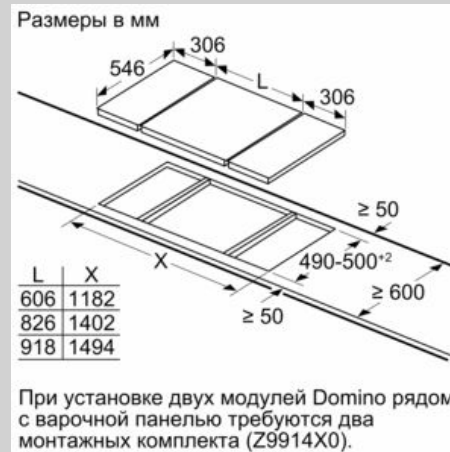
Возможные комбинации Domino с соответствующих приборов и размеров выреза

Типовая ширина: 30 40 60 70 80 90 Ширина прибора: 306 396 606 708 826 918